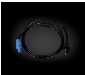
Сетевой кабель PowerCon

Для использования Power Shot необходимы следующие аксессуары (приобретаются отдельно):