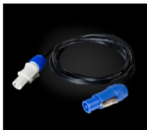
Соединительный кабель PowerCon