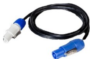
Соединительный кабель PowerCon