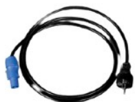
Сетевой кабель PowerCon

Аксессуары для Kabuki Drop DXM можно приобрести отдельно: